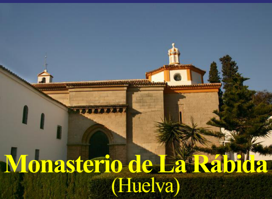
Monasterio de La Rábida (Huelva)