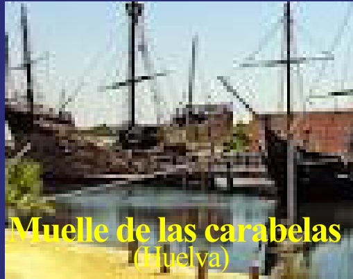
Muelle de las carabelas (Huelva)