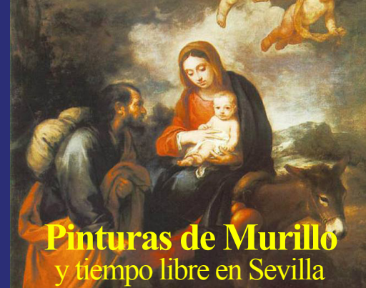
Pinturas de Murillo y tiempo libre en Sevilla