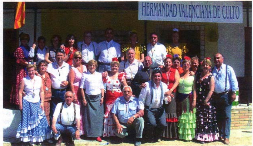
Un grupo de hermanos de nuestra Hermandad en la puerta de la casa que tuvimos este año en la aldea del Rocío

Los actos del día finalizaron con una salve a la Virgen que fue entonada por todos los presentes