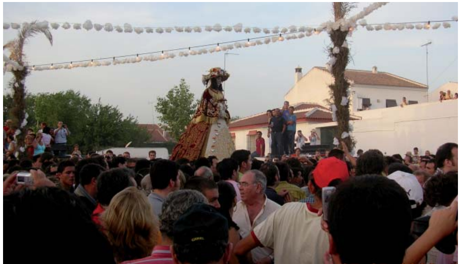
Llegada de la Pastora Celestial a la aldea del Rocío

A partir de entonces ha estado en la Parroquia de la Asunción de Almonte siendo venerada por cientos de miles de peregrinos que desde la citada fecha a la semana antes de la Pascua de Pentecostés han visitado la villa almonteña para caer a los pies de la Pastora Celestial, pues hay que recordar que durante el traslado la Virgen luce traje de pastora, así como su Hijo, de ahí el nombre de Pastorcito Divino, aunque lo de Pastor en Jesús tiene otras connotaciones. Pero cuando sale de la aldea se le pone una especie de guardapolvo a la imagen de la Virgen, cubriendo asimismo la cara con una capucha para evitar