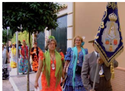
Llegada a La Palma del Condado

Como todos los años, la víspera de "hacer el camino" con nuestra Hermandad Madrina de La Palma del Condado, asistimos a las 20:30 h. a la Misa de Acción de Gracias en la Capilla del Convento de las Hermanas de la Cruz. En esta Misa participaron también la Hermandad de Palma de Mallorca y la Asociación de Hortaleza.