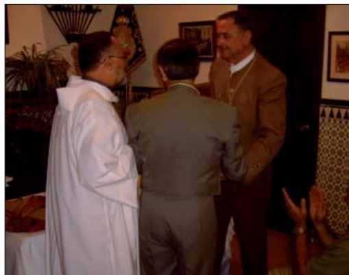
Los capellanes de las Hermandades valencianas concelebran la Misa. A la derecha nuestro Hermano Mayor entrega la placa con nuestra medalla a la Hermandad de Ntra. Sra. del Rocío de Valencia.

Siguiendo la tradición de los últimos años, después de que una representación de nuestros hermanos encabezada por el Hermano Mayor,