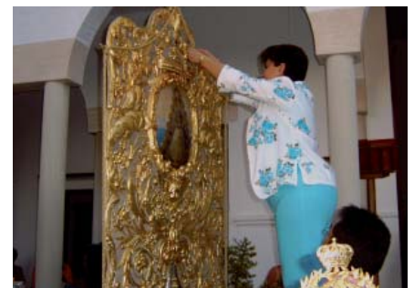
Imposición de medalla al Simpecado

El día siguiente, viernes 2 de junio, a las 7