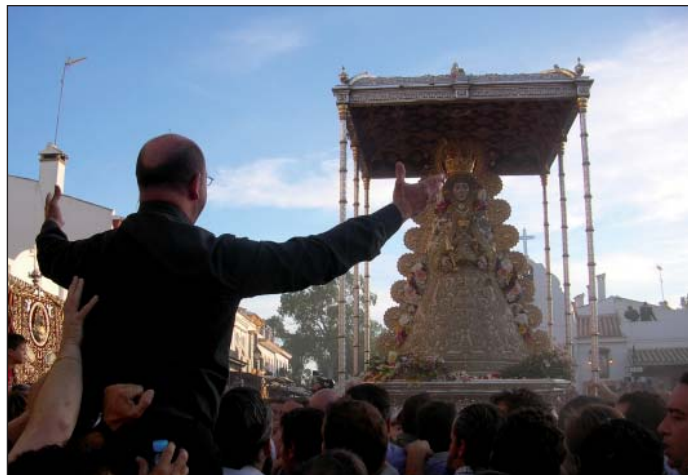
Nuestro capellán rezó la Salve a la Reina de las Marismas.

del Pastorcito, haciendo entrega de las ofrendas que todos los romeros llevaban para esta institución benéfica.