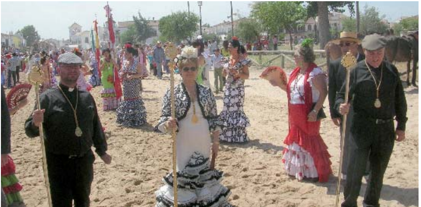
El sábado, a las 12:30, iniciamos la procesión para presentarnos, junto con Hortaleza y La Palma, ante la Santísima Virgen del Rocío.